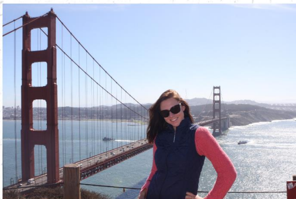
San Francisko lielais Golden Gate bridge